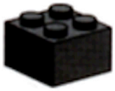
Brique 2 X 2