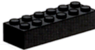
Brique 2 X 6