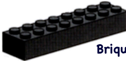
Brique 2 X 8