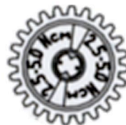
Engrenage de transmission de 24 dents

Pour identifier les roues d'engrenage, calculez le nombre de dents qu'elles possèdent.