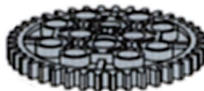
Roue d'engrenage de 40 dents