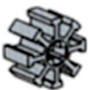
Roue d'engrenage double de 8 dents