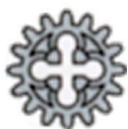
Roue d'engrenage de 16 dents