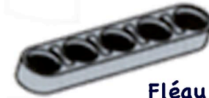
Fléau (5 trous)