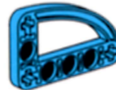
Bras de levier à angle droit fermé