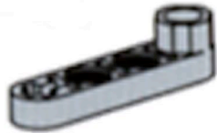
Bras de levier (Monte-charge)