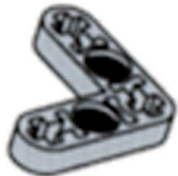
Bras de levier (Angle droit)