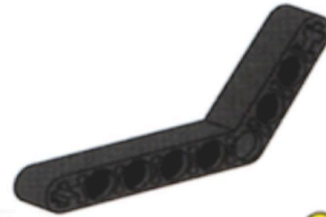
Fléau à angle (Petit)