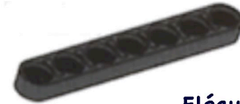
Fléau (7 trous)