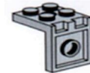
Plaque en angle 2 X 2

Pour calculer la grandeur d'une plaque, comptez le nombre de tenons (petits points) sur celle-ci, en largeur et en longueur.